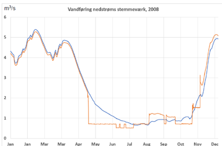
Figur 3-2 2008 kurver for vandføring hhv. uden stemmeværk og indvinding (blå) og med nyt stemmeværk, indvinding på 3,5 mill. m 3 /år og ny styring, nuværende klima (orange)

Figur 3.2 viser, at vandføringen midt i april falder med ca. 1.500 l/s. Dette sker selvom der kun indvindes 111 l/s - i ny tilladelse 222 l/s fra Tissø. Forskellen skyldes at der spares vand op ved ny styringsmodel, som det sker i dag, hvor der arbejdes med sigtekurver.