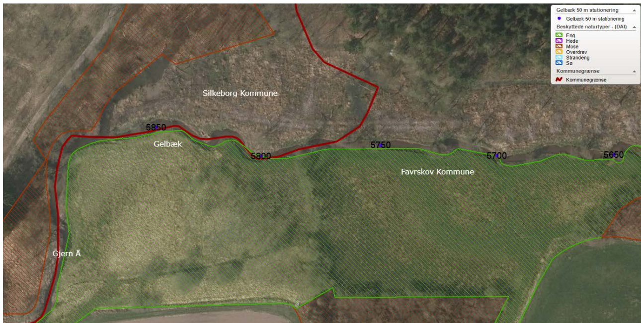
Figur 1. Gelbæk med stationering de sidste 400 meter ud af i alt 5.871 meter. Der er tale om ny stationering i forhold til eksisterende regulativ. Stationeringen er tilpasset kommende revideret regulativ. Gelbæk løber ud i Gjern Å.