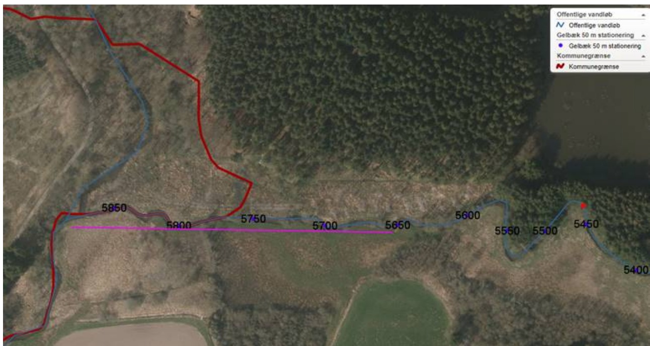
Figur 2. Luftfoto 2018. Pink streg er strækningen hvor bunden oprensnes (st. 5.687 – 5.871). Rød prik viser, hvor langt op oprensningen forventes at ville påvirke vandstandshøjden i Gelbæk.

Gennemgang af luftfoto viser, at arealerne har været slået og senest har været afgræsset i 2014, herefter har arealerne været for våde til at sætte dyr ud. Ved at dræne arealerne forventes det at blive muligt at genindføre høslet og afgræsning.